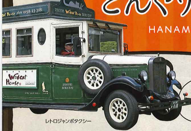
レトロジャンボタクシー