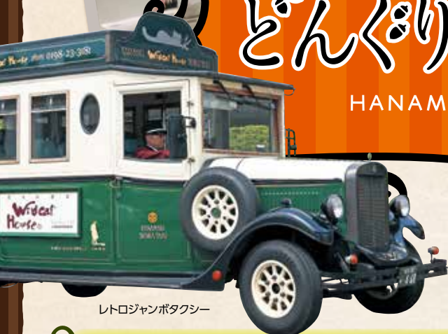
レトロジャンボタクシー